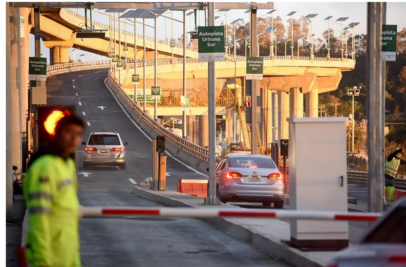
Acceso a autopista urbana, CDMX. - https://www.xataka.com.mx/otros-1/20-de-descuento-en-casetas-de-ciudad-de-mexico-a-autos-hibridos-y-electricos-con-el-nuevo-ecotag

Sin embargo, el proyecto debe diseñarse de tal forma que no se sobredimensione – que los usuarios que lo utilicen no sean suficientes para financiar las obras en el plazo presupuestado, ni se sature – que se cumpla la condición de flujo libre en la vía construida, con el fin de lograr el mayor impacto posible para la ciudad.