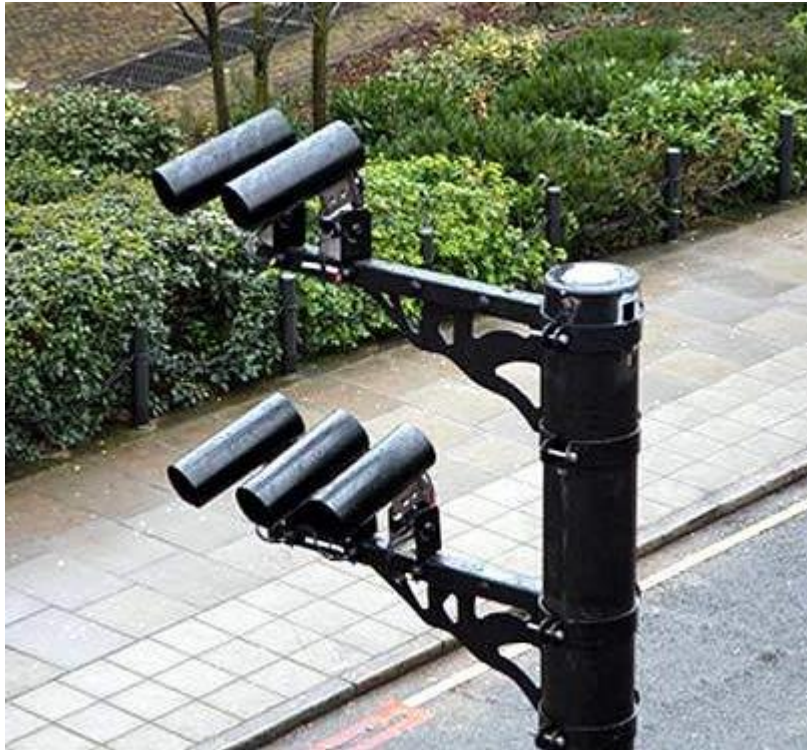
Sistema de ALPR para identificar el acceso a la zona regulada. Londres, Inglaterra. https://www.roadtraffic-technology.com/projects/congestion/attachment/congestion9/

Finalmente, se identificó que la tecnología DSRC es hasta el momento, la tecnología más empleada en todo el mundo en sistemas de peaje electrónico.